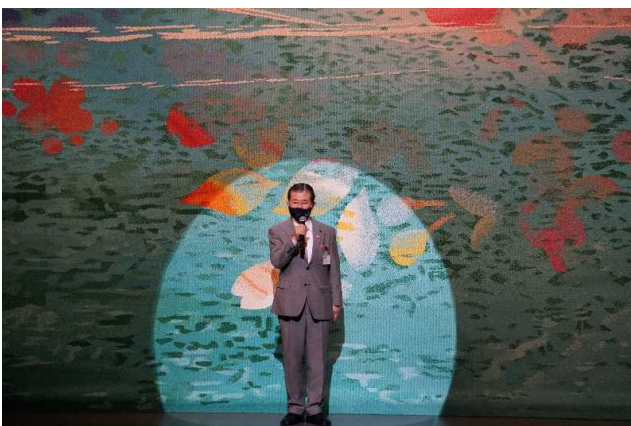
5月22日 閉演時市長あいさつ