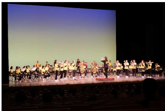
5月23日 特別出演(昭和小学校金管バンド)