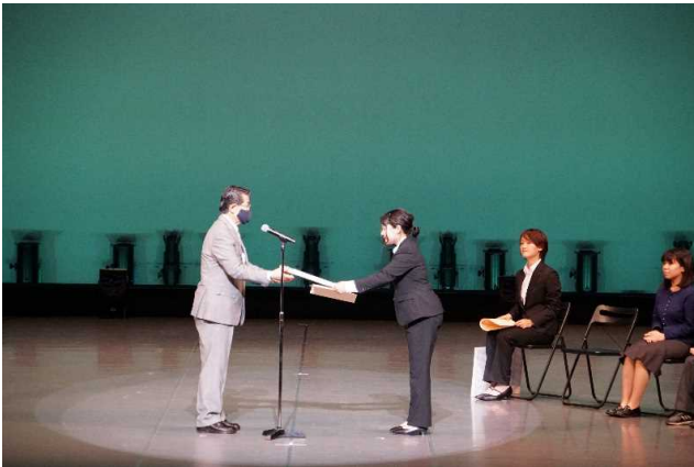
5月22日 子ども文化芸術賞授賞式