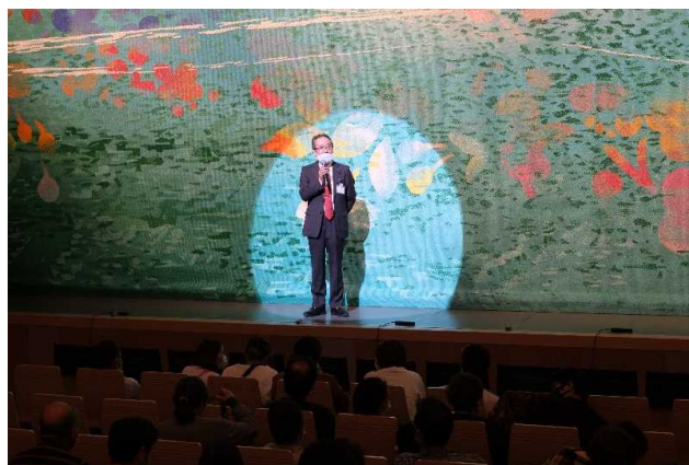
5月23日 閉演時部長あいさつ