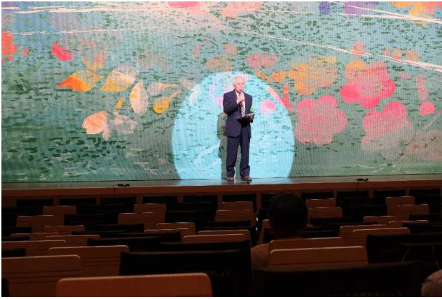
5月22日 開会式(会長あいさつ)