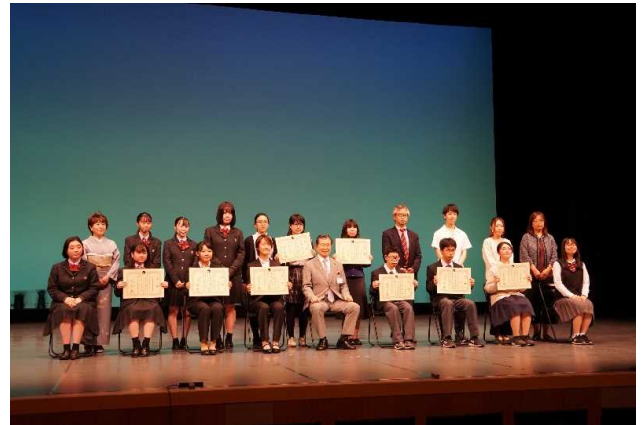
5月22日 子ども文化芸術賞授賞式