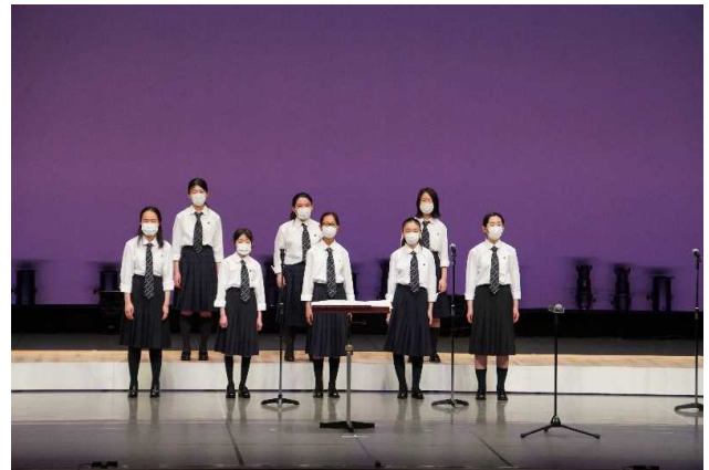
5月22日 特別出演(柳町中学校合唱部)