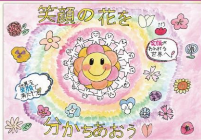
令和7年度 人権啓発ポスター・標語コンクール 小学生・中学生の部 最優秀賞作品