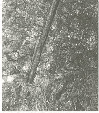
岩につきささったままの削岩用ロッド(約70cm)