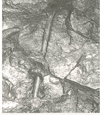
岩に残る削岩用ロッド跡