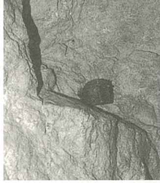
天盤にある壕の東西、水平を測った測点

■地下壕は、できる限り当時の状態のまま保存しておりますので、風化等により大変もろく崩れやすくなっている箇所や天盤が低い箇所があります。見学時は次のことを守って入壕してください。