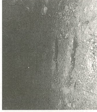
ずりを運んだトロッコの枕木跡