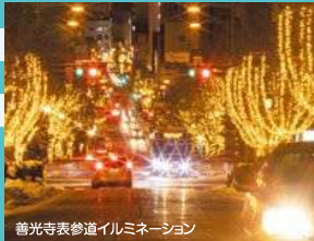
善光寺表参道イルミネーション