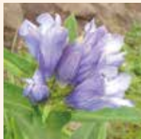
エンゾンドウ 8～11月 硯岩～山頂