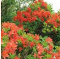
レンゲツツジ 5～8月 一の鳥居苑地～山頂