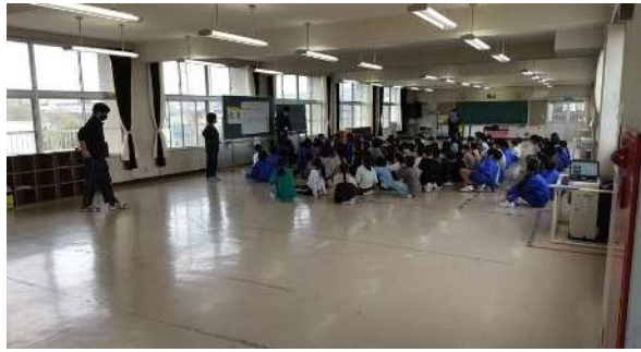
新たな居室としての利用を検討している北校舎 2 階の集会室