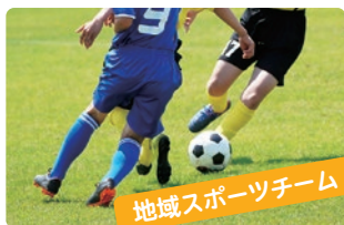
地域スポーツチーム