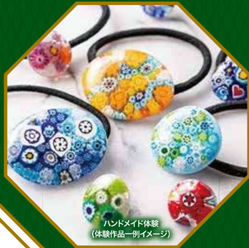
ハンドメイド体験 (体験作品一例イメージ)

魅力ある暮らしに触れ、出会いを楽しむ。 長野圏域で移住・婚活を考えてみませんか?