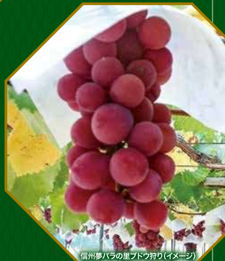
信州夢バラの里ブドウ狩り(イメージ)