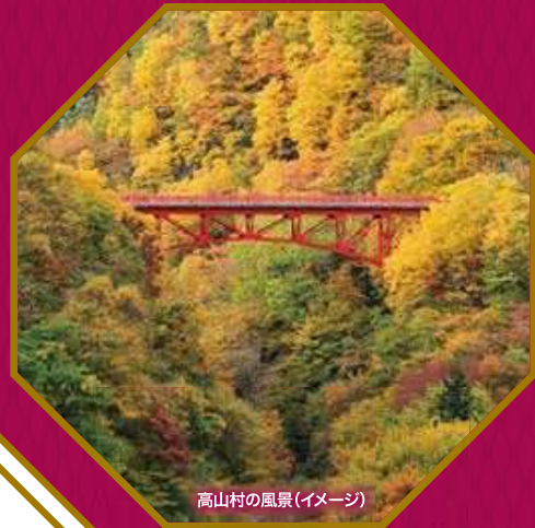
高山村の風景(イメージ)

魅力ある暮らしに触れ、出会いを楽しむ。 長野圏域で移住・婚活を考えてみませんか？