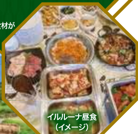
イルルーナ昼食 (イメージ)