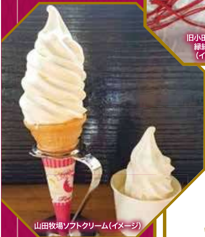
山田牧場ソフトクリーム(イメージ)