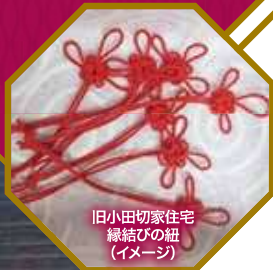
旧小田切家住宅 縁結びの紐 (イメージ)