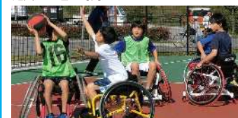
実施内容/競技用の車いすに乗って、バスケット ボールを体験してみよう!

会場/メインアリーナ 協力/K9車いすバスケットボールクラブ 参加対象/車いすで自走が可能な方 定員/20名 時間/9:30~11:30