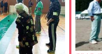
実施内容/究極の生涯スポーツ「グラウンド・ゴルフ大会」で盛り上 がる。

協力/スポーツ推進委員 参加対象/地域住民どなたでも 定員/なし(集まれた方でチーム編成) 時間/9:00~12:00