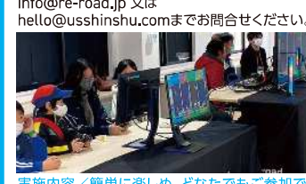
実施内容/簡単に楽しめ、どなたでも参加 できます。eスポーツについて学び、実際に体験 してみましょう!

会場/総合体育館サブアリーナ 協力/アーバンスポーツ信州 参加対象/小学生以上 定員/混雑状況に応じて制限させていただきます お問合せ/お名前、年齢、ご連絡先を記入の上、 info@re-road.jp 又は hello@usshinshu.comまでお問合せください。