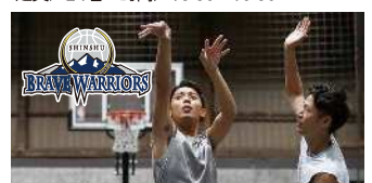
実施内容/3人制バスケットボール[3×3]!東京 オリンピック新種目を楽しもう!

会場/メインアリーナ 協力/信州ブレイブウォリアーズ 参加対象/バスケットボール経験者(チーム参加可) 定員/24名 時間/13:30~15:30