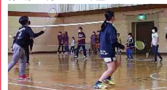
実施内容/基本技術を学んで、楽しいミニゲームを行います!

協力/篠ノ井ジュニアバドミントンクラブ 参加対象/小・中学生 定員/30名 時間/10:00~12:00 持ち物/室内シューズ 貸出しラケットあり