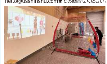
実施内容/トイドローンを操作して風船や的に 当てて勝負(1クール3名、5分ずつ交代。)

会場/総合体育館サブアリーナ 協力/アーバンスポーツ信州 参加対象/小学生以上 定員/混雑状況に応じて制限させていただきます お問合せ/お名前、年齢、ご連絡先を記入の上、 hello@usshinshu.comまでお問合せください。