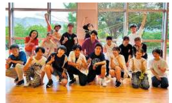
実施内容/体験会・パフォーマンス披露 9:45~ 10:15~ 10:45~ 11:15~

会場/総合体育館サブアリーナ 協力/アーバンスポーツ信州 参加対象/小学生 定員/各20名 時間/9:30~11:30(15分体験会を4回ほど) お問合せ/お名前、年齢、ご連絡先を記入の上、 sese0627@gmail.com又は hello@usshinshu.comまでお問合せください。