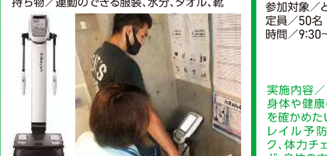
実施内容/InBody測定(体重、体水分量、部位 別筋肉量、たんぱく質量など)やトレーニングの 質を高めるプログラムです。

会場/トレーニング 参加対象/一般の方 定員/各6名 申込A 時間/①10:00~11:00②11:00~12:00 持ち物/運動のできる服装、水分、タオル、靴