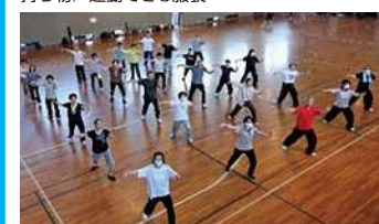
実施内容/誰でも気軽にゆったりとした太極拳 の動きを体験してみませんか

会場/柔道場 参加対象/制限なし 定員/15名 時間/受付:9:00~9:30 体験会:9:30~11:30 持ち物/運動できる服装