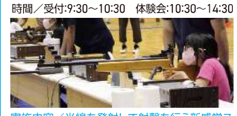
実施内容/光線を発射して射撃を行う新感覚ス ポーツ!ビームライフル、ビームピストルを使って 射撃を楽しもう!初心者も丁寧に指導します。

会場/メインアリーナ 参加対象/小学4年生以上の方 (小学4~6年生は保護者同伴) 定員/45名 時間/受付:9:30~10:30 体験会:10:30~14:30