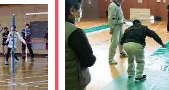
実施内容/スマイルボウリングで楽しく世代を超えて交流しよう。

協力/スポーツ推進委員 参加対象/どなたでも 定員/100名 時間/9:00~12:00