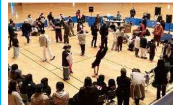
実施内容/体験会・パフォーマンス披露 9:45~ 10:15~ 10:45~ 11:15~

会場/総合体育館サブアリーナ 協力/アーバンスポーツ信州 参加対象/小学生 定員/各20名 時間/9:30~11:30(15分体験会を4回ほど) お問合せ/お名前、年齢、ご連絡先を記入の上、 choppabreakinstudio@gmail.com又は hello@usshinshu.comまでお問合せください。