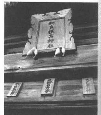
軻良根古神社の扁額

平成6年には新幹線開通に伴い、神社境内や建物の大改修が行われ、今日に至っている。