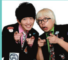
お笑い芸人 2人のトイボックスさん