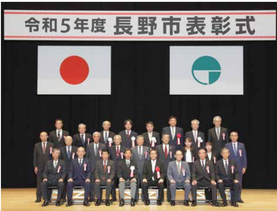
地域自治功労表彰、社会福祉功労表彰、保健環境功労表彰を 受けた皆さん

■公益のため市に300万円以上の 金品を寄付 ▽一般社団法人長野県資源循環保全 協会 ▽一般社団法人日本ライオンズ