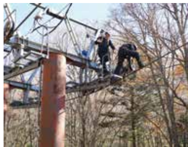
▲リフトの鉄塔に昇り、索輪の点検、取り換え作業を行っている様子

冬場、特に気を配らなくてはいけないのは、夜中に大雪が降ったり、極端に気温が下がったりしたときで、そのような日の翌朝は、屋外の設備が凍ってしまいます。無理にリフトを動かすと故障する危険があります。故障により、お客さまにご迷惑をおかけしないよう、慎重に作業を進めています。