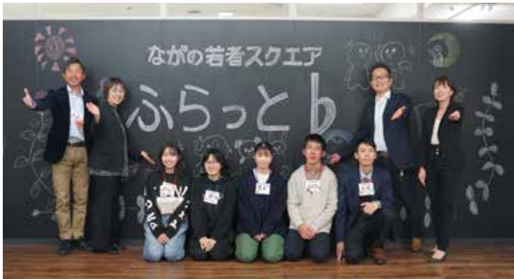
▲ふらっとbを「こんな場所にしたい」という願いで描かれた黒板アートの前で記念撮影