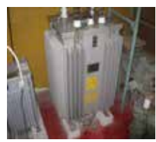
変圧器 (平成5年以前製造)

低圧コンデンサーは、X線装置(医療用、工業用)や電気溶接機などの工作機械、昇降機、分電盤、揚水ポンプなどに取り付けられています。