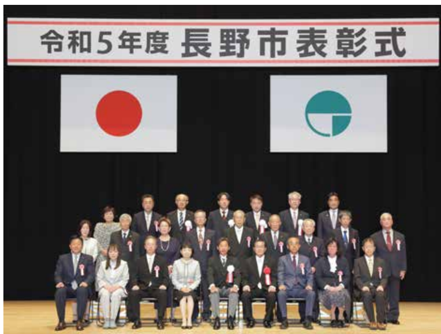
市政功労表彰、産業振興功労表彰、善行表彰を受けた皆さん