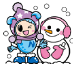
▲上下水道局イメージキャラクター「みずなちゃん」

自宅の水道を工事した給水装置工事業者へ依頼してください。借家にお住まいの方は、家主か管理会社へお問い合わせください。費用は自己負担となります。