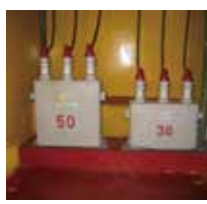
高圧コンデンサー (平成2年以前製造)