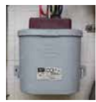
低圧コンデンサー (平成2年以前製造)

PCB廃棄物の保管および処分などは、市への届け出が必要です。また、処分には専門業者との契約が必要です。