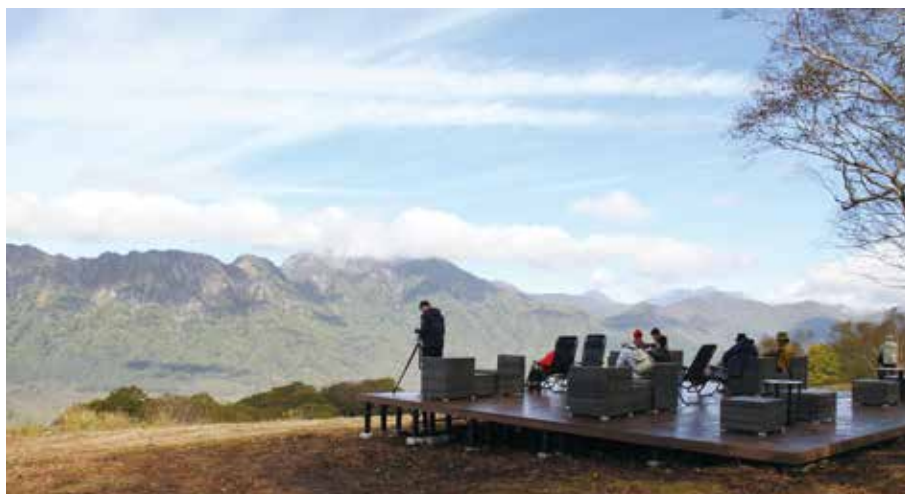
秋山リフト運行に際し、怪無山山頂に設置された展望デッキの様子(10月13日撮影)

怪無山山頂は、戸隠連峰が一望できる最高の場所です。県内のスキー場では夏山リフトなどをやっていたり、戸隠でもできないかと考えていたとき、観光庁の補助金を知り、今年初めて秋山リフト