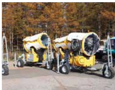
▲電気を動力源としている降雪機

これからも、より多くの人に、年間を通して楽しめる戸隠の素晴らしさを知ってもらえるように、さまざまな取り組みを進めていきたいですね。