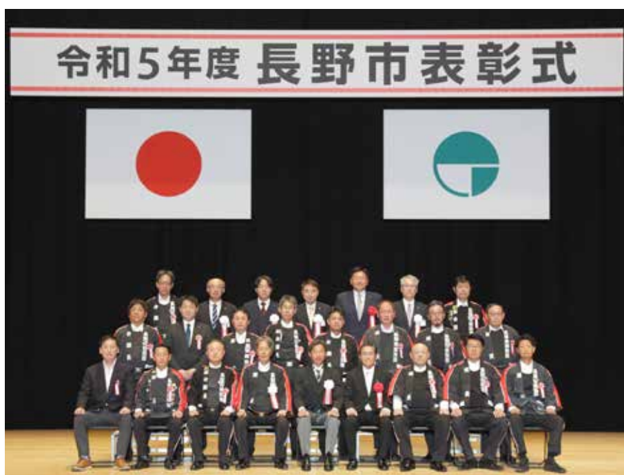
市政功労表彰(消防)を受けた皆さん