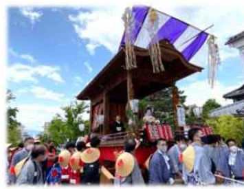
伝統的祭礼実施の支援やPR (御祭礼屋台巡行)