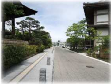
道路美装化 (御幸坂通り)