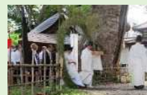
湯福神社の茅の輪くぐり