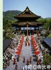
御開帳における中日庭儀大法要