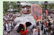
弥栄神社の御祭礼