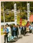
鬼無里の伝統的祭礼にみる歴史的風致