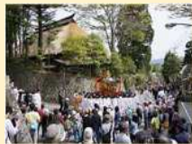
戸隠神社の式年大祭