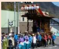
白髯神社の祭礼(神楽)