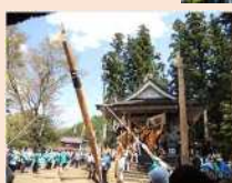
鬼無里神社の祭礼(屋台)