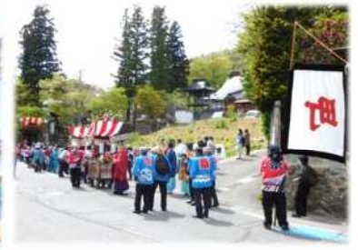
(鬼無里神社の祭礼)