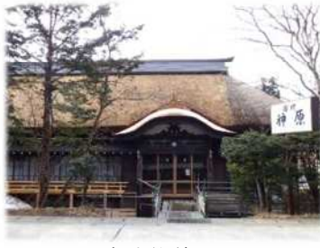
建造物修理 (戸隠伝統的建造物群保存地区)