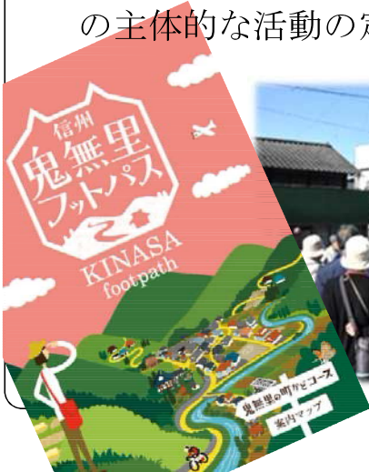
ガイドボランティアのまち歩き研修