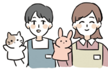
児童センターや保育園の先生