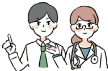
学校の先生 担任や保健室、部活の先生