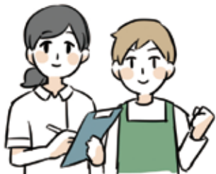
家族のケアをしている ケアマネジャー、ヘルパー