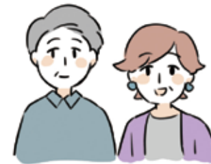
近くに住んでいる人 親戚や民生委員・児童委員