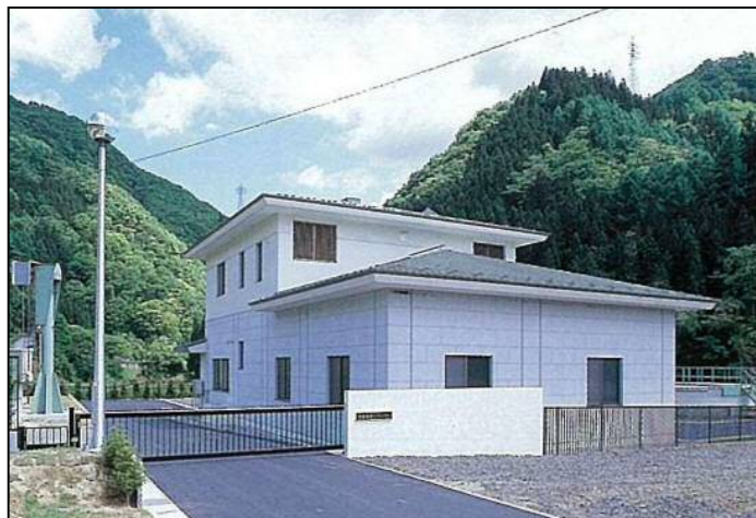
鬼無里浄化センター