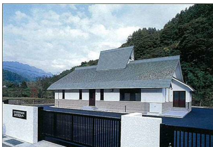
上里浄化センター