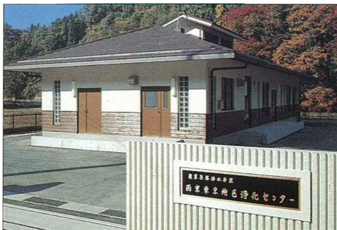
西京東京地区浄化センター