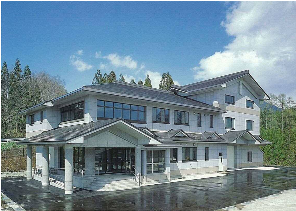
戸隠高原浄化センター