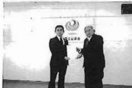
令和4年12月22日 千曲川河川事務所表彰