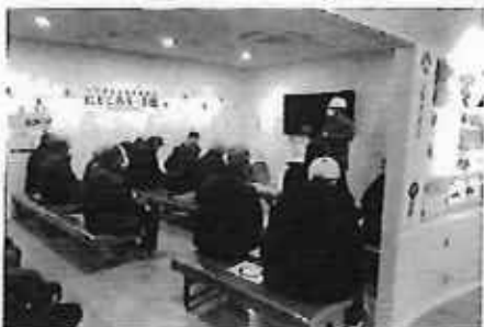
令和4年12月16日 大河津分水路 にとこみえ一る館 (管外視察)