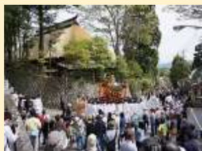
戸隠神社の式年大祭