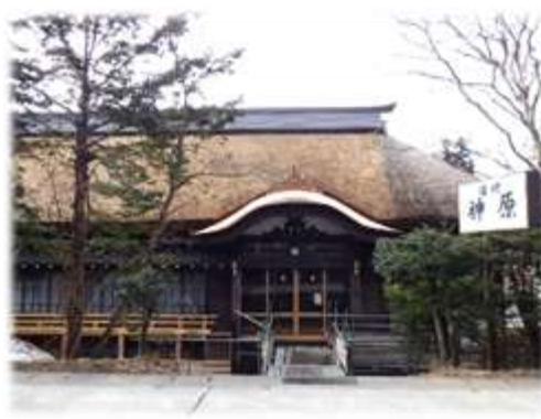
建造物修理 (戸隠伝統的建造物群保存地区)