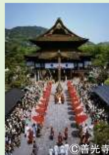
御開帳における中日庭儀大法要