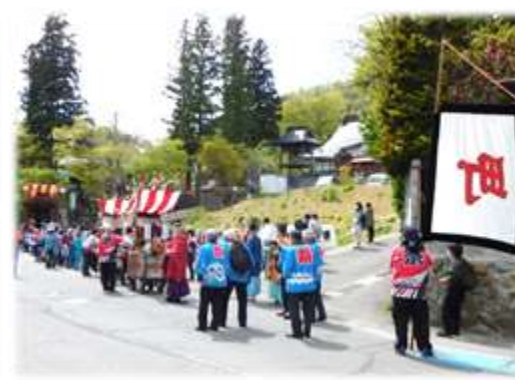
(鬼無里神社の祭礼)