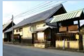
松代道の宿場(川田宿)