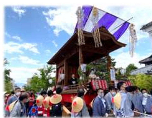
伝統的祭礼実施の支援やPR (御祭礼屋台巡行)