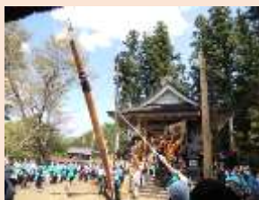
鬼無里神社の 祭礼(屋台)