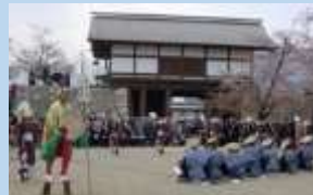
松代城跡で行われる 大門踊り