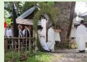
湯福神社の茅の輪くぐり