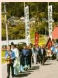
鬼無里の伝統的祭礼にみる歴史的風致