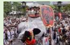
弥栄神社の御祭礼