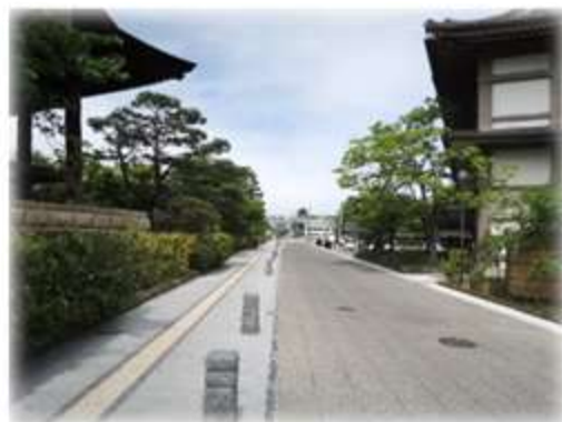
道路美装化 (御幸坂通り)