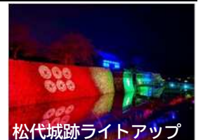
松代城跡ライトアップ

市内の多様な文化財の魅力を市民や来訪者(観光客等)の誰もが知ることができ、その本質的価値を理解し、日常的に活用していくことで、文化財の保存と活用の好循環を生み出していく。