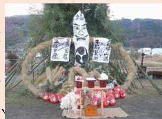
篠ノ井越の人形道祖神

市域では山地・盆地で多様な生活文化が生まれ、地域間の交流がなされてきました。山地・盆地の生産生業・商品流通を背景として郷土色豊かな食文化も発展し、おやきに代表される粉食は今も人々に親しまれています。多様な生活文化を背景にして、市域各地では多様な年中行事・祭礼・芸能が行われてきました。現在でも道祖神の祭、獅子舞、御柱祭などが盛んに行われ、神社や地域の祭事にあわせた花火の打ち上げも見ることができます。