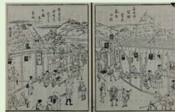
善光寺宿駅繁花茶店の図『善光寺道名所図会』

古来より多くの人々を迎え入れてきた長野市は、交流を軸として生み出されてきた多彩な歴史文化を現在に伝えています。