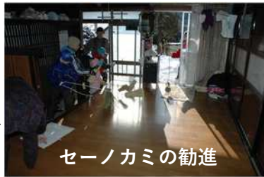
セーノカミの勧進

【主な構成文化財】 芦ノ尻の道祖神祭り、人形道祖神、小正月関係コレクション、えびす講花火、獅子神楽など