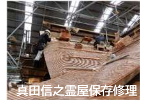
真田信之霊屋保存修理

経年劣化や災害等による文化財の滅失・損傷を防ぎ、確実に保存していくため、日常の維持管理と計画的な修理を行う。