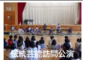
伝統芸能訪問公演

社会環境の変化による文化財の担い手不足や、保存に関わる専門人材の不足、保存に必要な資金・資材の不足に対して、市民・行政・民間団体等が一体となって次世代に継承していく仕組みを構築する。