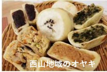
西山地域のオヤキ