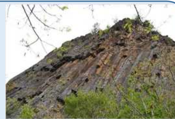
貉郷呂山の石切場

太古の昔、海だった長野市域は、その後の激しい地殻変動によって長野盆地と東西の山地からなる地域となりました。この地殻変動は市域に暮らす人々に湧水や温泉、石材といった恵みをもたらす一方で、地震や水害といった災害をもたらしてきました。