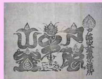
戸隠山から出されたお札

市域には、社会の様々な人々と結縁する開かれた霊場として、多くの人々の信仰を集めてきた善光寺を筆頭に、修験の聖地であり、水を司る神として全国に名が知られていた戸隠山や、近世に地域の修験者を統括していた皆神山など、多くの宗教的拠点が存在しています。また市域では近世、里修験や聖と呼ばれる宗教者たちが地域の人々の信仰を支えていました。