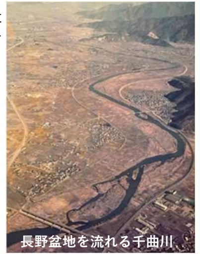
長野盆地を流れる千曲川

【主な構成文化財】 千曲川流域の漁具、大豆島区有文書、果樹栽培関係資料、千曲川流域の治水土木遺産など