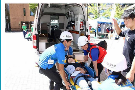
緊急搬送訓練の様子