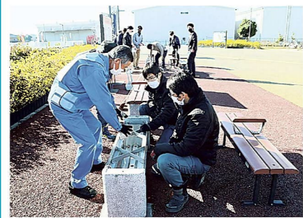
かまどベンチ利用説明の風景