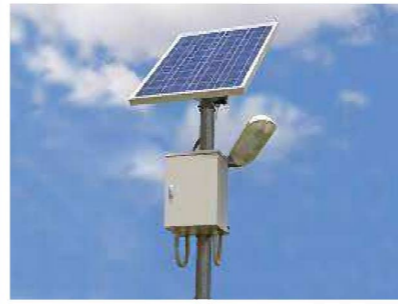
太陽光パネル外灯