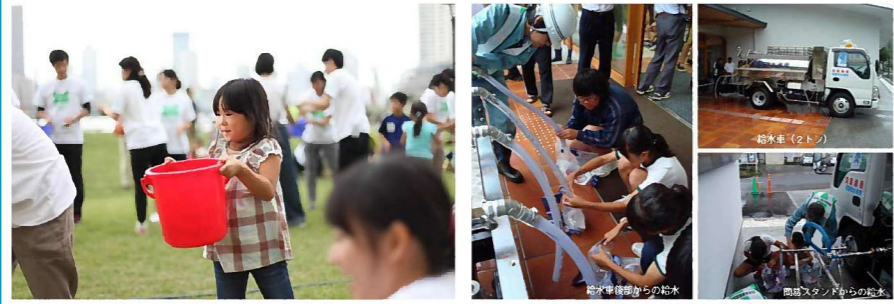
広場での給水活動などのイベントの様子