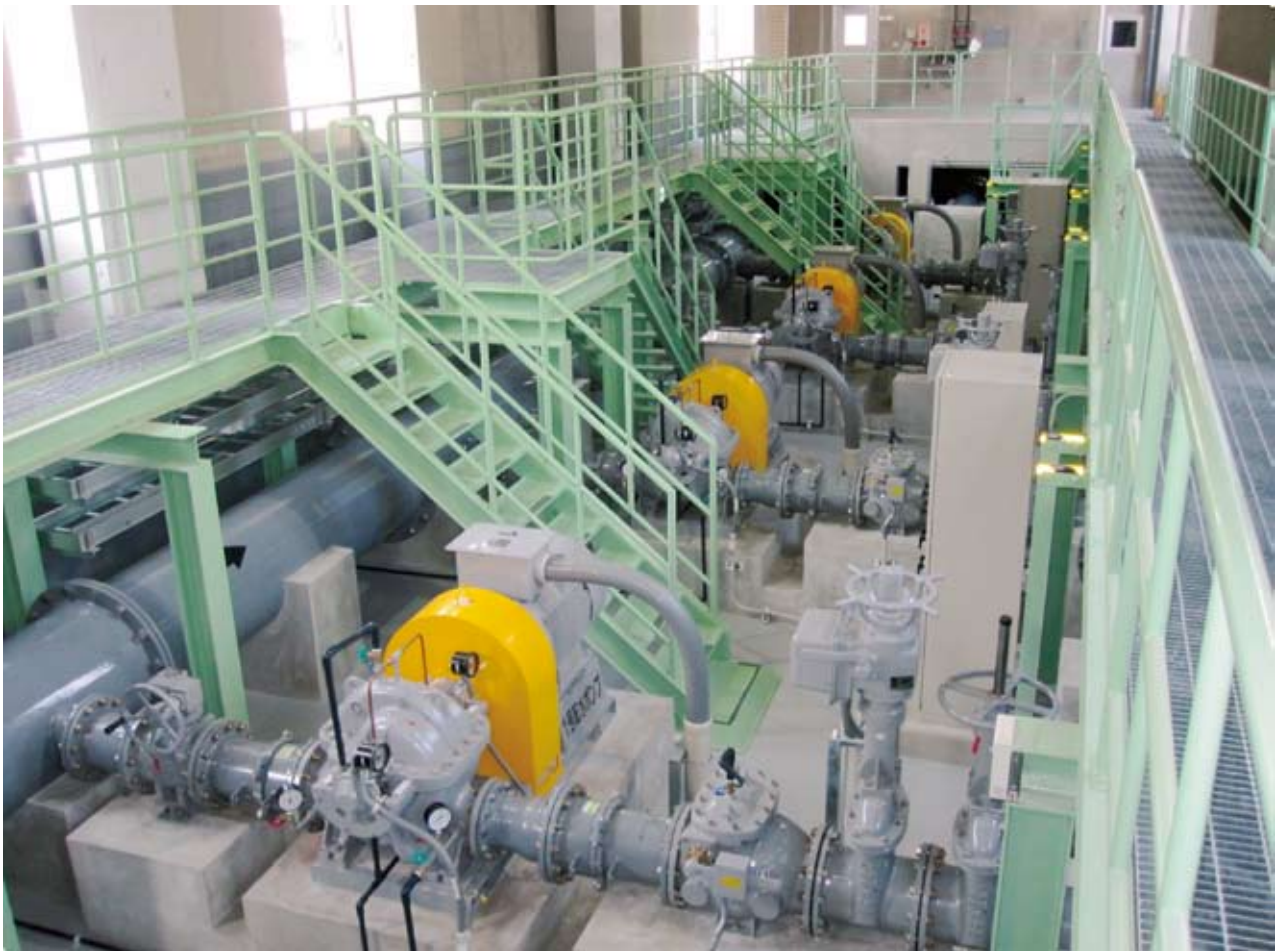
川合新田水源 送水ポンプ 平成22年竣工