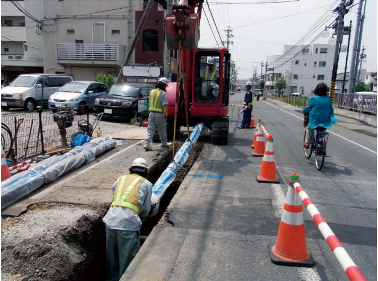
老朽管を耐震管に布設替え