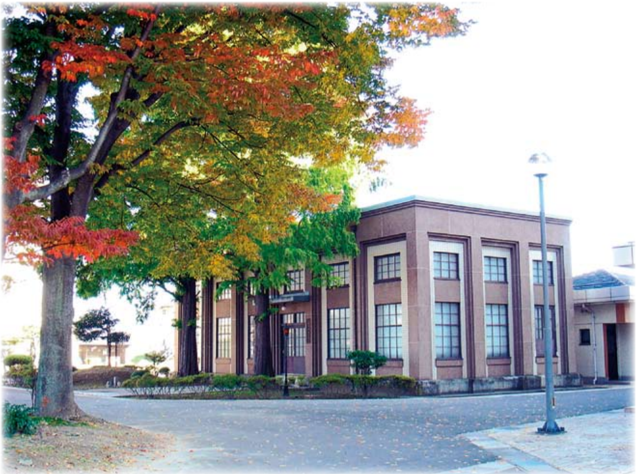
水道資料館 昭和4年（1929）犀川水源送水ポンプ場上屋としてつくられた建物