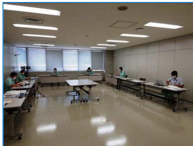
上下水道局災害対応訓練の様子