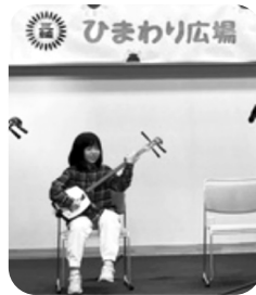
三味線、楽しく弾けました

ひまわり広場は、大人から子どもまで楽しくわいわい遊べる場所なので来てみてください。来年もひまわり広場が開催され、演芸広場にまた出られる機会があったら、練習して、もっと上手くなっていきたいと思っています。これから三味線を精一杯やりたいです。