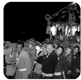
美和神社祭礼・夢神輿