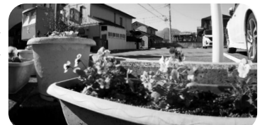
ポスト脇で春を待つ花の鉢 ピオラ

の会」。誕生したのが20年前の平成16(2004)年。親睦を目的にスタートしました。「着付けなら任せて」「英語をちよつと」など、メンバーそれぞれが得意とする分野を生かして「月替わり講師」役を務め、年数回活動を重ねました。