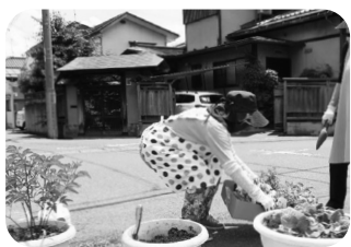
花の鉢を世話する「ひまわりの会」メンバー

最近の活動は、交差点脇に置いた鉢植えの花を世話するのが中心です。真夏と冬を前にした年2回、植え替え作業に加え、花の季節には毎日水やりも欠かせません。近年は猛暑続きで、カンカン照りの道脇に置く花を選ぶのにもひと苦労。とくに暑かった昨年夏は、