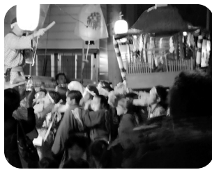
飯縄天神合殿神社祭礼・樽神輿