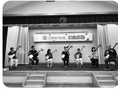
花岡社中の皆さんと演奏

本番ではトップバッターになり、緊張していましたが、始まると楽しくなり、緊張なんて吹っ飛び、軽い気持ちで弾けたので良かったです。教えてください。いただいた人たちに感謝の心です。