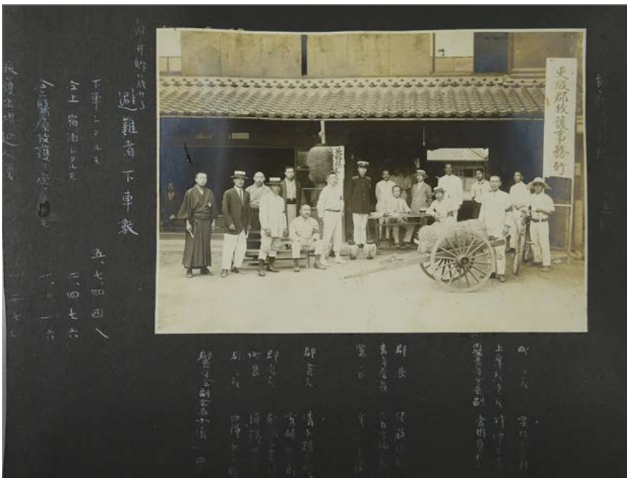
松本満家文書『更級郡救護事務所前の首脳』

関東大震災から、100年が経ちます。歴史はくり返すという言葉通り、本年1月1日にも、能登地方を中心に大きな地震が起きています。過去の出来事から学ぶことはたくさんあります。100年前の人々が示した地域のまとまりや助け合いの姿は、現在に生きる私達にも通じるものがあります。