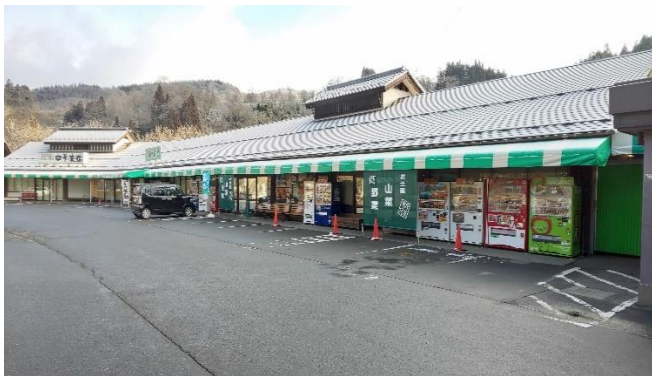
地場産業振興市場