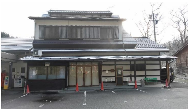
旧活性化センター