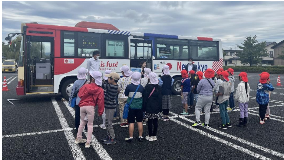
バス乗り方教室の様子