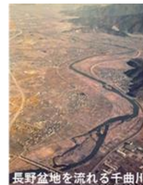
長野盆地を流れる千曲川

千曲川水系がもたらす恵みと脅威を受けてきた人びとの暮らしを伝える物や伝承からなる文化財群