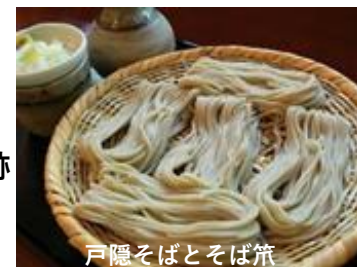
戸隠そばとそば箸

山岳信仰とともにつくられてきた戸隠の歴史文化を伝える建造物、祭礼、食文化からなる文化財群