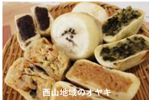
西山地域のオヤキ

【主な構成文化財】 麻・畳糸作り道具、粉食、 鬼無里の屋台・神楽、 紙店資料など