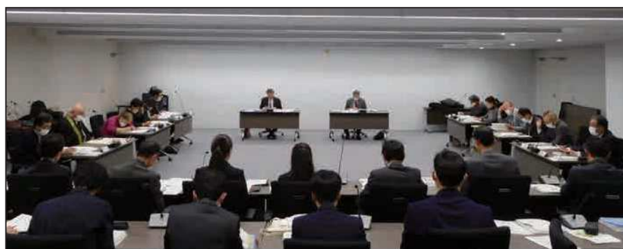
長野市歴史的風致維持向上協議会 (R6.1.18)