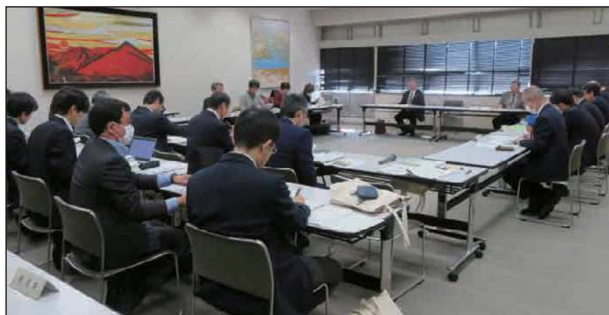
長野市歴史的風致維持向上協議会 (R7.2.10)