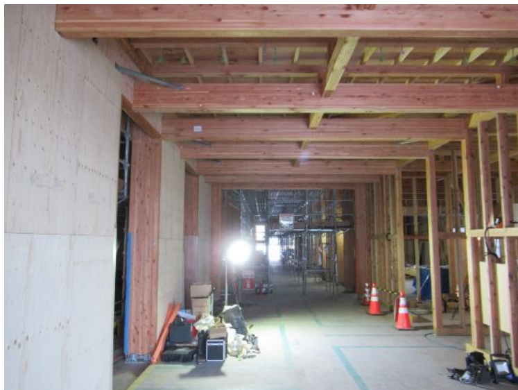
フロントロビー(R6年1月26日現在)