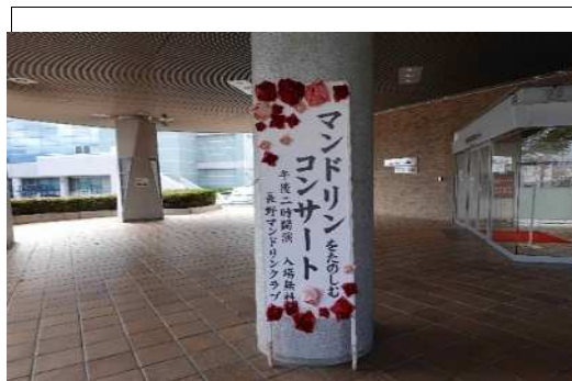
(写真説明1) ホール入口看板