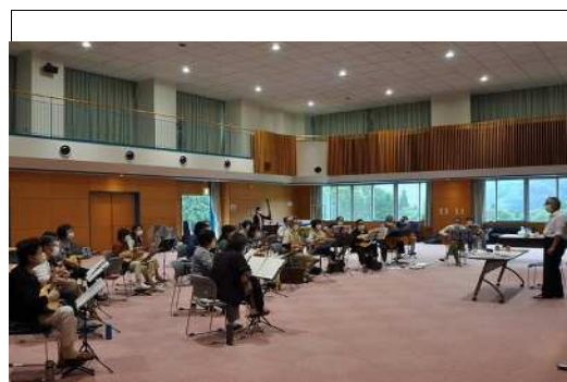
(写真説明4) 練習風景