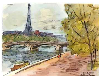
セーヌ川 / 1961 / 水彩・紙 / フランス