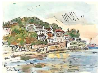
熱海 / 1962 / 水彩・紙 / 静岡県