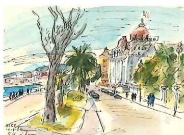
NICE / 1964 / 水彩・紙 / フランス