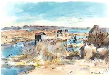
土浦にて / 1953 / 水彩・紙 / 茨城県