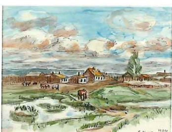
満州風景 / 1934 / 水彩・紙 / 中国