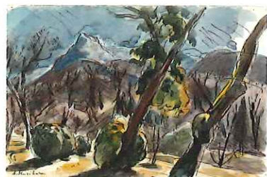
姥子 / 制作年不詳 / 水彩・紙 / 神奈川県