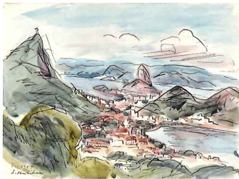
リオデジャネイロ / 1957 / 水彩・紙 / ブラジル