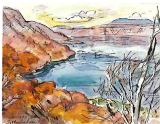
十和田湖 / 1963 / 水彩・紙 / 青森県