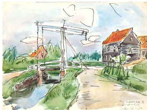
マルカン島 / 1964 / 水彩・紙 / オランダ

休館日：月曜日【※以下の各日は開館 7/15、8/12、9/16、9/23、10/14、11/4、1/13】・祝休日の翌日・年末年始