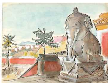
承德 / 制作年不詳 / 水彩・紙 / 中国

本展では、栗原信と信州新町との芸術を通じた豊かな繋がりを紹介するとともに、2020（令和2）年に、ご遺族から寄贈された256点の作品から、日本並びに世界各地の風景を描いた水彩画など約160点を前・後期に分けて展示します。