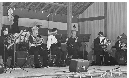
アンサンブル・シュムック