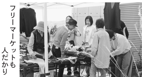
フリーマーケットも 人だかり