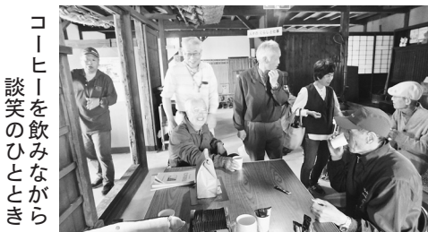
コーヒーを飲みながら 談笑のひととき