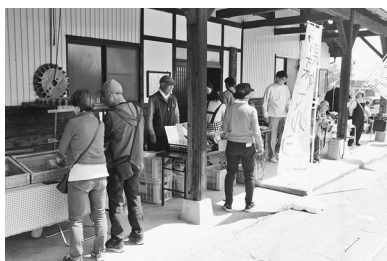
郷土歴史資料館前 オープン直後

「七二会をもっとPRしたい！地域を活性化したい！」との思いで住民有志が立ち上げた「七二会ふるさと会議」の主催で初めて開催しました。次回は、同会場で6月20日(土)午前10時30分から開催予定です。ふらっと立ち寄って、みんなでお茶飲み話でもしてみませんか。