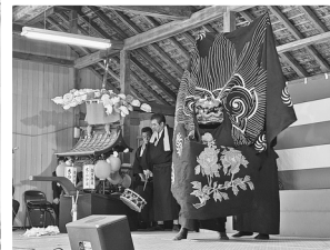
瀬脇若連太々御神楽