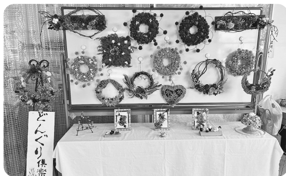
七二会公民館サークル「どんぐり倶楽部」作品展示 〔4月七二会公民館ロビーにて〕