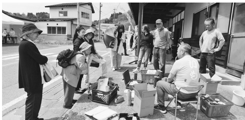
竹ランタン作りのブースに興味深々