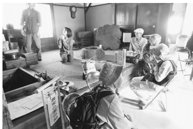
囲炉裏のある お茶の間で一休み