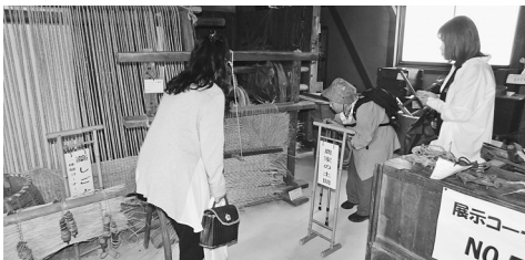
郷土歴史資料館の展示を懐かしむ来場者