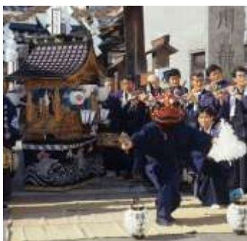
犀川神社の太神楽