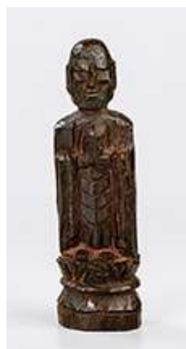
善光寺大幸作の仏像