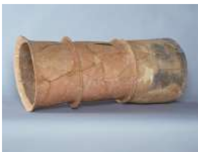
埴輪円筒棺 (川柳将軍塚古墳出土)