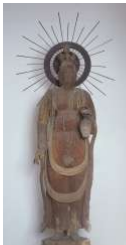
正覚院の観音菩薩