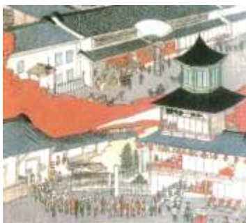
開業当時の長野停車場