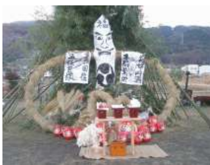
篠ノ井越の人形道祖神