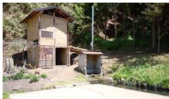
おに おに かまや かまや の釜屋