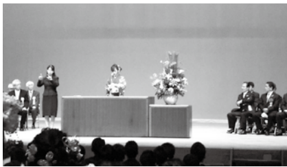
決意を新たに誓いの言葉