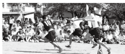
第69回校庭大運動会

施しているのは3校と聞いている。本校では、各学年がダンスをメインにしたパフォーマンスが伝統的に行われ、喝采を浴びてきた。クラス対抗の大縄跳びもある。運動会という行事を通して、一人一人の生徒は、各々場面で自分の役割をやり抜くのである。やり抜いたからこそ達成感、満足感を味わう。これは自分を鍛える中で、学級集団が育っていくひとつの姿である。感謝したいことは、そんな生徒の姿を大勢の保護者、地域の皆様が会場で見守ってくれていることだ。本当にありがたい。その眼差しの温かさが、本校を支え、生徒を育てているのだと思う。