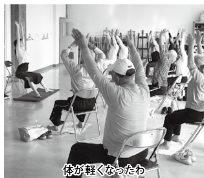
体が軽くなったわ

受講後、皆さんから「体が軽くなったわ」「腰の痛みがなくなったよ」と、笑顔と喜びの声。また実施して欲しいとの要望を沢山頂きました。ぜひ来年度も企画していきたいと思