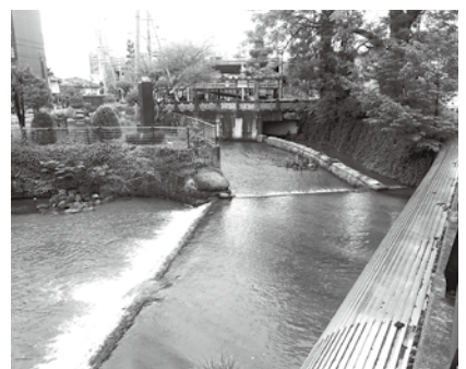
大口分水に残る石碑

裾花川の氾濫を防ぎつつ農業用水を確保するという、江戸時代初期の工事によって扇状地の上に市街地が発展していく基礎ができたともいえます。その反面、裾花川には大雨が降って増水すると昔の川筋をたどって流れたがるクセ（自然の姿に戻ろうとする力）が働きます。防災を考える上では、こうした川の自然の姿を知っておくことも重要になるのです。（次回「ひまわり公園と活断層」です）