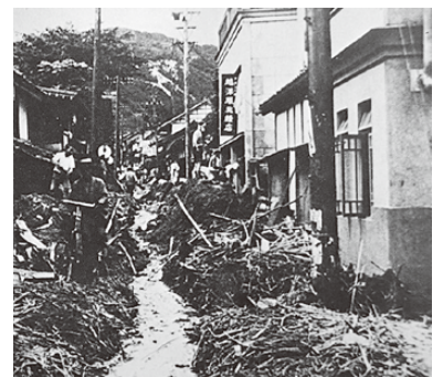
昭和12年 湯福川氾濫