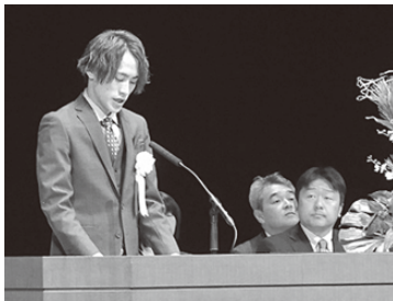
決意を新たに誓いの言葉