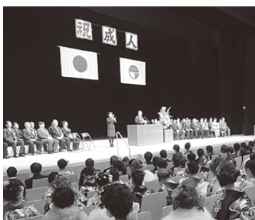
成人式に臨む新成人