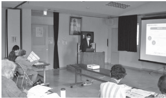
講師の説明を熱心に聴く参加者

続いて、終活については、これまでの人生の振り返りをしつかりとしてから自分の今を多面的に見つめること。そのうえで、これからの自分のことや家族に伝えたいことなどを考えるようアドバイスがありました。