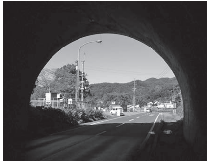
銚子口トンネル (鬼無里側出口)

頼朝山・松島トンネルをくぐり、裾花ダム付近から険しい谷筋に入ります。そしてトンネルをいくつかくぐり、かつて柵(しがらみ)と呼ばれた人里に入ります。そして、また険しい谷を走り、最後に銚子口トンネルを抜けると一