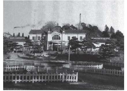
シリーズその9 (189号) 長野市公民館 (旧商品陳列館)

写真は、昭和4年に撮影された城山公園一帯。 3つ並ぶ池が千鳥ヶ池。中央に見えるのが周囲に馬場道を配し真ん中に東洋一の大噴水を備えた御大典記念公園。その背後に商品陳列館(後の長野市公民館)が見える。公園の左隣が、長野体育協会城山グラウンド。 令和4年現在、これらすべてが姿を変えてしまった。