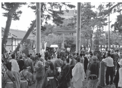
健御名方富命彦神別神社の御柱