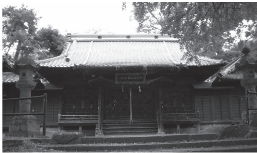
シリーズその10 (190号) 城山の高台 健御名方富命彦神別神社

城山の高台には、かつて横山城が築かれ、上杉勢の山城が置かれていた。14世紀頃、横山城の主郭は、現在の健御名方富命彦神別神社(水内大社)本殿のある場所にあり、善光寺を守るために、守護方が築いた城であったと考えられている。