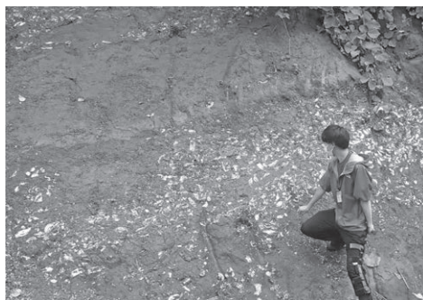
海だった証拠、裾花川沿いのカキ化石

逆に、険しい渓谷の部分は、海底火山が噴火した時にできた溶岩や凝灰角礫岩などの硬い地層でできています。こうした硬い地層を削って裾花川が流れているという事は、裾花川が古い川であることを示しています。荒倉山や虫倉山がまだ山になっていない、丘だった時代からこの場所を流れていたのでしょうか。そして、その後この一帯が隆起し、