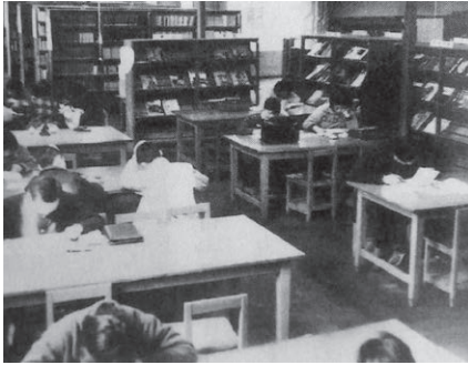
日米文化センター図書室 (旧CIE図書館)

昭和21年(1946)4月、文部省は公民館構想を発表し、戦後の日本社会における社会教育の重要性を説いた。 長野市では、昭和22年12月20日をもって長野市公民館開設の日とし、旧商品陳列館を改修してあてた。しかし、昭和25年には総司令部民間情報教育局図書館となり公民館は移転した。昭和39年には、「城山館」跡地に移転し現在に至っている。