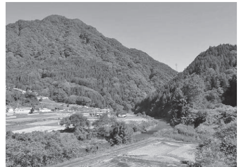
山に向かって流れる裾花川

実は、鬼無里をはじめ市の西部の山間地で人里ができている場所は海底に堆積した泥や砂の地層でできています。これらの地区で、海にすんでいる貝類の化石が発見されていることは、そうした海底が隆起していることを示します。また、この地域は、地すべりが多く発生してきた場所でもあるのです。融雪期の大量の