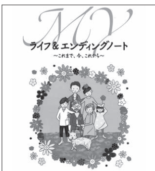
エンディングノート

城山公民館では、今後とも多方面と連携して、時代と市民ニーズに合わせた講座を企画してまいりますので、どうかご期待ください。(小池)