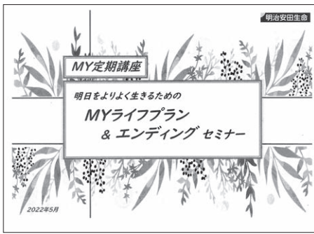
終活講座テキスト

10月18日(火) 10時から、第二地区住民自治協議会と共催で「フレイル予防&終活講座」を開催しました。人々の平均寿命が延びている現代、寿命が延びたからこそ、健康