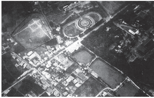
シリーズその8 (188号) 姿を変える城山公園

今回も番外3として、今までのシリーズからいくつか紹介してみたいと思います。 (号数は館報No)