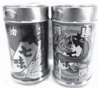
記念品の七味缶セット

くれる人がいるからこそ前に進んでいることを実感しています。会社は地域密着型であり、私自身もこの地域に育ててもらった一人です。これからは社会人としての責任を胸に、仕事を通じて地域に貢献できる大人でありたいと思っています。そして将来は、周囲から信頼され、誰かが困っているときにそつと手を差し伸べられるような、心に余裕を持った大人になりたいと考えています。そのためにも、自分の成長を止めることなく、日々進化し続けていくことを誓います。