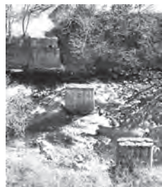
茂菅大橋より撮影

新諏訪町の旭山橋を里島側に渡った県立長野商業高校第二グラウンド北側の裾花川の流れの中に 2 脚が建っている。『長野市誌第 6 巻歴史編近代 2』によると、同鉄道が運行されていたのは、昭和 11 年(1936) 11 月から昭和 19 年 1 月までの足掛け 8 年余り。太平洋戦争の戦況悪化に伴い、運行期間は短かった。場所柄、人目に触れずひっそりと 90 年余の歴史を感じさせる遺構である。 ※善光寺白馬電鉄の通称名