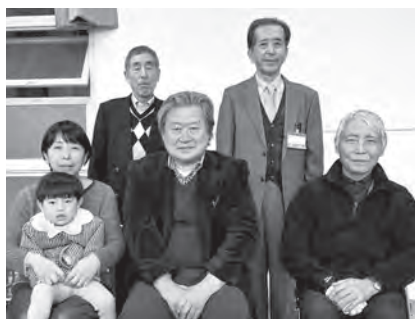
令和 7 年度 館報編集委員

そこで、年度替わりを迎え心機一変。気概は、春の木々の芽吹きのように、昨日より今日、今日より明日、という意気込みで「館報城山」の編集に取り組みたいと思います。(萩原)