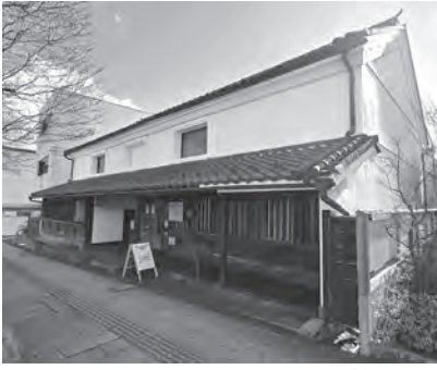
門前商家ちよっ蔵おいらい館

して、江戸時代中期頃から菜種油製造問屋で、菜種油(水油)や蝋燭等を扱っていた。戦前までは長野市内で唯一の大規模製造所で、大正期には年間約 660 石(119,057 リットル)の油を製造していた。』とある。この説明文を読んで、館報城山の前号(令和 7 年 12 月 1 日発行)の「街並み散歩 その 2 (新諏訪町編)」の取材時に参考にした『新諏訪町 70 周年記念誌』(平成 18 年刊行)に『龍宮淵水車屋の盛衰』と題した記述があったことを思い出した。同書には『裾花川の水利を利用し搗屋(つきや)の地に明治 32 年(1899)頃、東町の三河屋本店が大資本を投じ、中堰の中間の土地と水利権を買って、県下最大の設備と称せられた製油工場を建設し、盛んに菜種油、胡麻油を搾った。この工場は操業約 38 年で昭和 12 年(1937)閉鎖した。』とあり、地元の方による当時の回想文には、『製油工場の前を香ばしいにおいを嗅ぎながら泳ぎに通った。』と綴られていた。