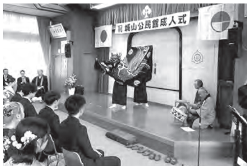
瓜割神楽保存会のみなさん

令和8年1月11日(日)に城山公民館成人式が地元善光寺事務局講堂で行われました。当日は、幸い降雪もなく、二十歳の門出にふさわしい日になり、会場には、第一・第二地区から99名の新成人が参加し、久しぶりの友との再会を果たした賑やかな光景が見受けられました。