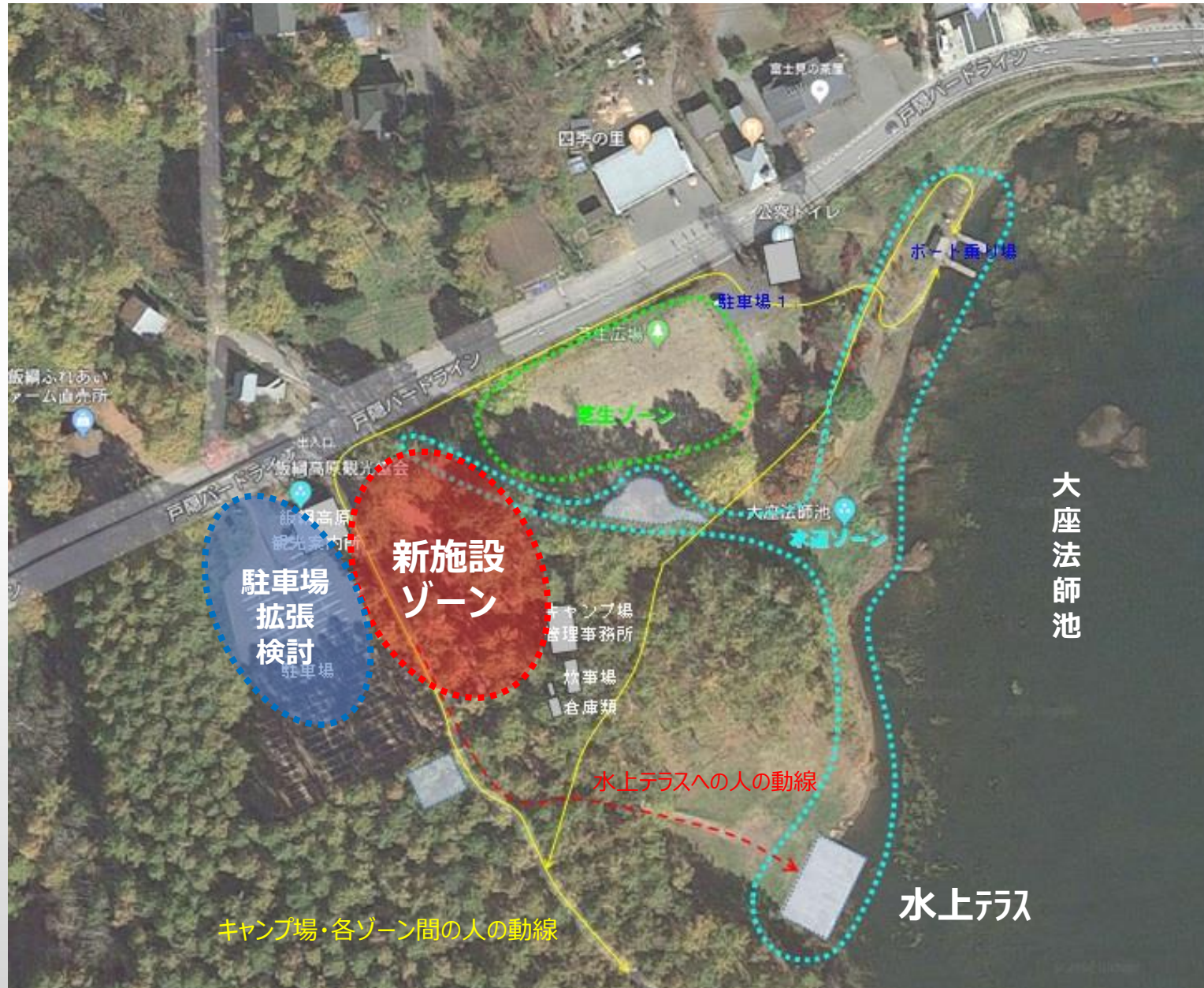
図：施設の位置図（案）