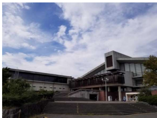
前回の「やまびこ国体」で建設された 長野運動公園総合体育館

※1 アーティスティックスイミング(旧シンクロナイズドスイミング) ※2 令和4(2022)年度以降の実施種別による ※3 センターファイアピストル