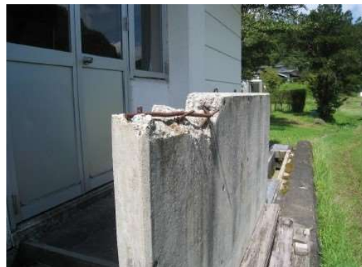
露筋したコンクリート壁