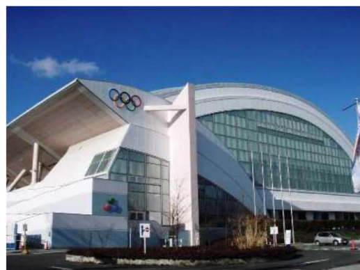
長野オリンピック冬季競技大会・長野パラリンピック冬季競技大会 で建設されたアクアウィング

◆今までのニュースレターや公共施設マネジメントの情報は、HPへ！ 【長野市ホームページ＞組織で探す＞公共施設マネジメント推進課】