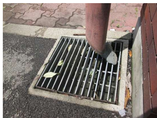
排水能力が低下した雨水枡