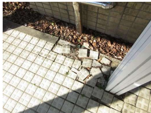
散乱した歩行用タイル