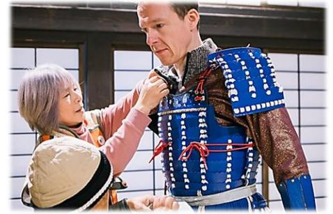
現在行われている体験例 （甲冑着付け）

💡 真田宝物館のリニューアルを起点とした体験型観光・回遊の創出や周辺地域との広域連携によって、観光誘客が高まる可能性がある。