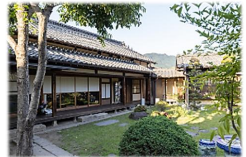
民間事業者による一層の 利活用を期待する寺町商家

💡 民間事業者が独自で行える利活用の範囲と公益性の高い範囲を分離し、複数の文化施設を対象に、長期契約（10年間以上）とすることで、実現の可能性が高まる。