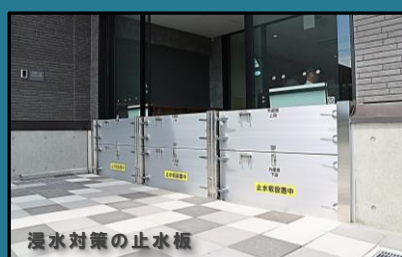
浸水対策の止水板

各種イベントや大人数での会議等が開催可能。災害時に垂直避難できるハシゴも設置している。