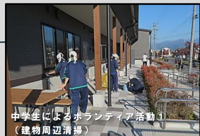
中学生によるボランティア活動1 (建物周辺清掃)

開所から1年半が経ちましたが、防災拠点だけではなく、地域交流の場として定着しつつあります。