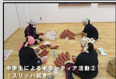
中学生によるボランティア活動2 (スリッパ拭き)