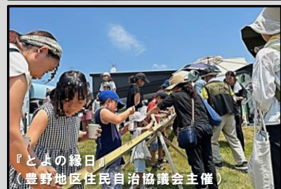
『とよの縁日』 (豊野地区住民自治協議会主催)