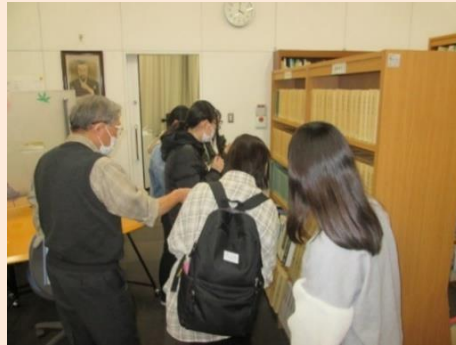
市公文書館（閲覧室）

“自分たちが行ける公共施設”という視点で、バス、電車を利用して移動できる中心市街地などの公共施設を訪問しました。