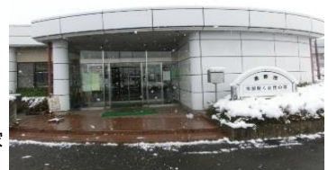
南部働く女性の家