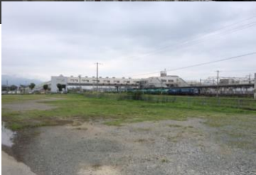
篠ノ井駅西口市有地