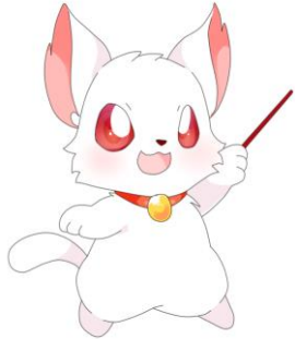
長野市の公共施設マネジメント のマスコット「ミーコ」

人口減少時代を迎えた 長野市の公共施設等 について考える、初めての 市民シンポジウムです