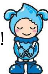
長野市上下水道局 イメージキャラクター 「みずなちゃん」