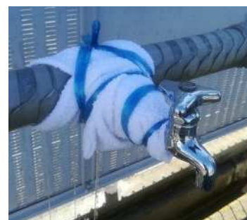
② 破裂箇所の止水の例