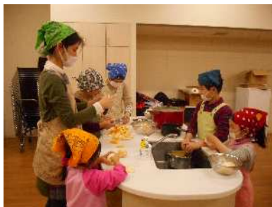
コミュニティルーム (調理室としての活用)