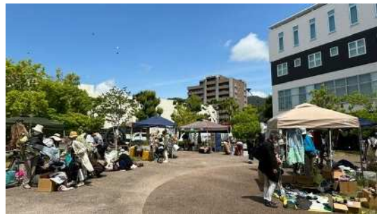
広場イベント利用