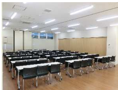
コミュニティルーム (1・2の一体利用)