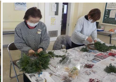
初めての方も素敵な仕上がりに！