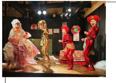
シアトリカルショー