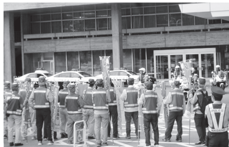
秋の全国交通安全運動出発式