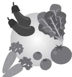
カリウムを含む野菜

1日の食塩摂取量の目標量 男性 7.5g 女性 6.5g 高血圧治療中 6g 未満