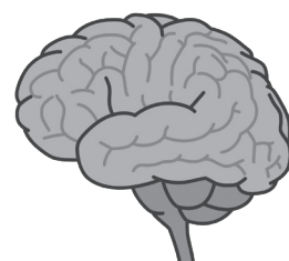
脳血管の全長は600km 青森～埼玉の距離