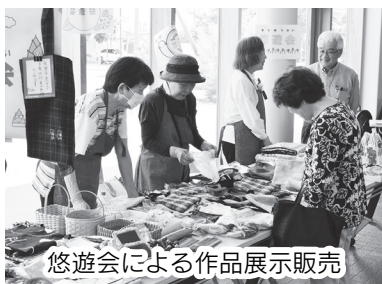
悠遊会による作品展示販売