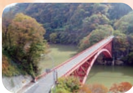
裾花溪谷に架かる裾花大橋 長野市 HP「ながの百景」より

＜発 行＞長野市老人クラブ連合会 長野市大字鶴賀緑町 1714-5 長野市ふれあい福祉センター 1 階 TEL : 090-2620-3520 FAX : 026-227-3520 ＜編集協力＞株式会社ニチコミ 静岡県静岡市駿河区南町 10-6 TEL : 054-283-5424