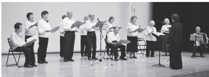
コーラル歌音は美しく澄んだ歌声を披露