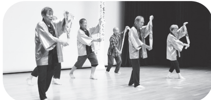
安来節の会による「安来節」(上)と「木曾節」(下)