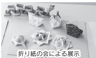
折り紙の会による展示