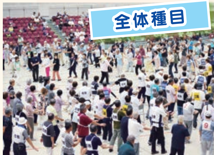
みんなで踊りました