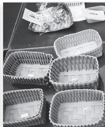
工作の会の作品販売