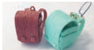
ランドセルのキーホルダー