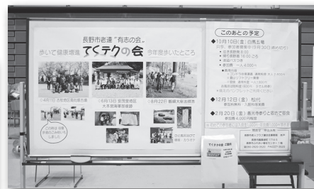
有志の会「てくテクの会」のパネル展示。 今年度の活動紹介と、今後の予定で参加者を募集