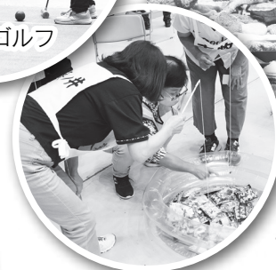
お楽しみコーナー