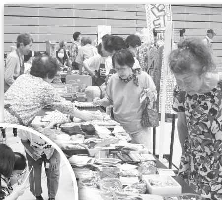
悠遊会の作品販売