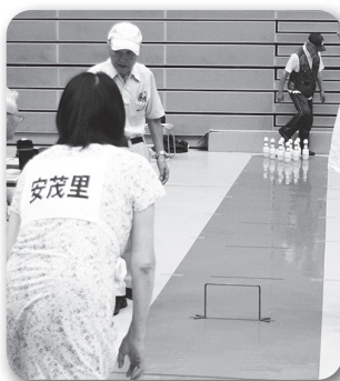
スマイルボウリング (写真: 上・右上)