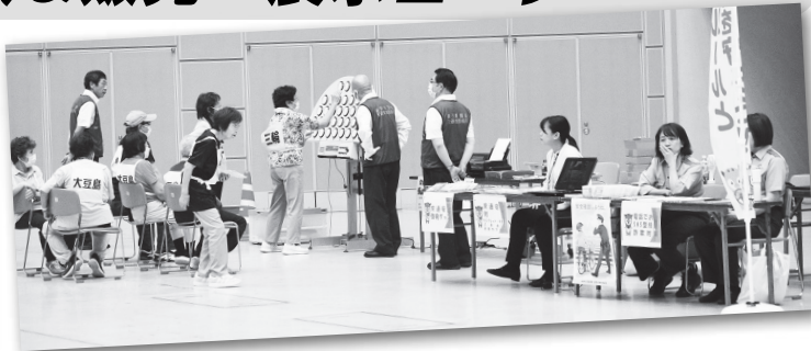
交通安全防止体験コーナー