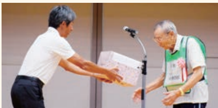
長野市より全員に参加賞が贈られました