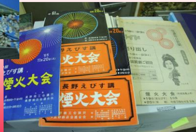
図 N386-ナ 長野えびす講関係資料 ↓