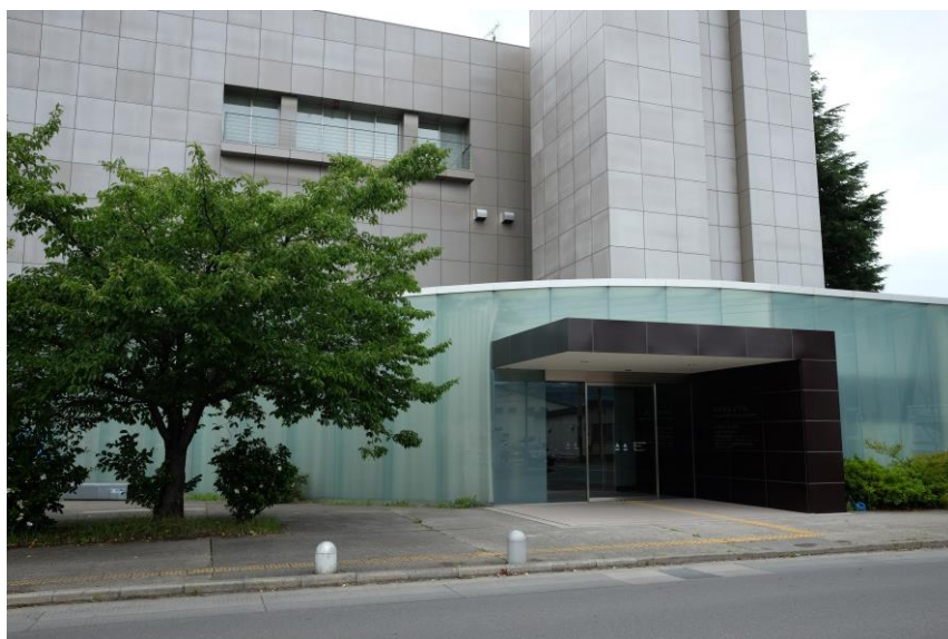
↑ 正面入り口 →

旧フルネットセンター改修工事が順調に進み、長野市若里分室に生まれ変わりました。長野市若里分室では、長野市公文書館のほか、2団体が業務を行う予定です。今号では、改修が終った長野市公文書館の姿を写真で紹介します。